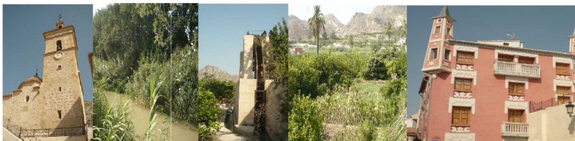
FIGURA 2. Paisajes y elementos históricos (Valle de Ricote).

El gran valor de los paisajes del Valle de Ricote reside en el equilibrio establecido entre los aprovechamientos naturales y la acción del hombre, que ha generado un paisaje cultural característico, y que en ocasiones es utilizado como seña de identidad de este territorio al ser denominado “el paisaje del Valle de Ricote” o “el paisaje morisco del Valle de Ricote”.